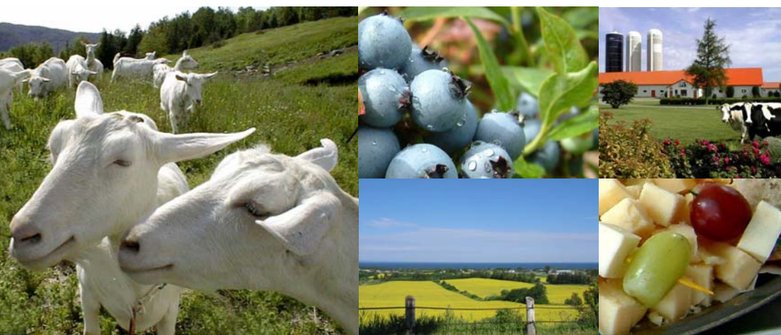
TABLE AGROALIMENTAIRE DU SAGUENAY-LAC-SAINT-JEAN

640, rue Côté Ouest Alma (Québec) G8B 7S8 Téléphone : 418 668-3592 Télécopieur : 418 480-3300 info@tableagro.com www.tableagro.com